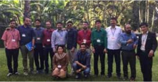
متدربون من أفغانستان أثناء التدريب الذي أقمنه في تنزانيا