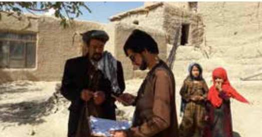
الفرق الميدانية في أفغانستان