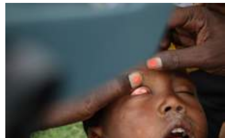
Un examinador hace un reconocimiento a un niño con la guía de tamaños de los folículos