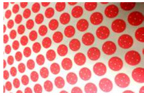
Pegatinas de guía de tamaños de los folículos