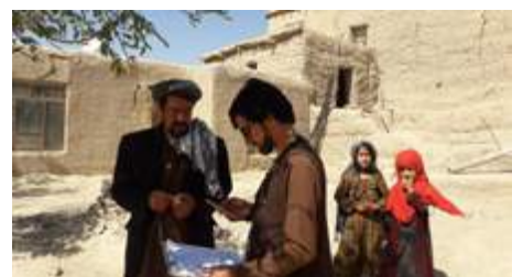
Equipos sobre el terreno en el Afganistán