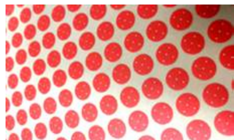
Autocolantes do Guia do Tamanho dos Folículos