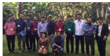
Formandos do Afeganistão na nossa sessão de formação na Tanzânia