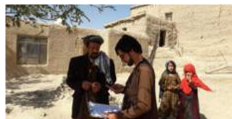
Equipas no terreno no Afeganistão